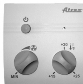
manuálny CP 10RT