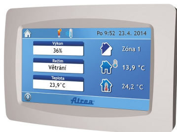
dotykový CP touch

Voliteľne osadzovaný digitálny systém, ktorý sa ovláda cez internetovú aplikáciu, pri ktorom nie sú potrebné ovládače. Je možné ju prevádzkovať v režime konštantného prietoku. V prípade požiadavky je možnosť objednať aj ovládače: dotykový CP Touch alebo manuálny CP 10RT.