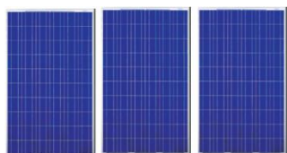
FV panely SOLVIS SV60 – 330|

Táto technológia sa skladá zo 3ks fotovoltaických panelov SOLVIS SV60-330W osadených na streche domu, na ktorej sa využíva najvhodnejšia možná slnečná strana (juh - východ). Následne sú tieto FV panely prepojené cez riadiacu jednotku LOGITEX 1-2,3 kW DC do zásobníka vody LX ACDC/M 160 l.